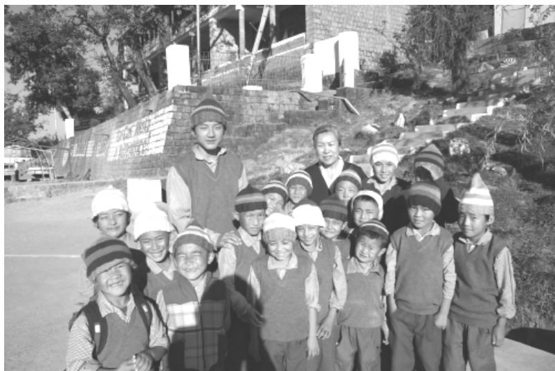
Jetsun Pema und eine Kindergruppe

Details zur nächsten Strickaktion finden Sie ab 9.12. auf www.savetibet.net