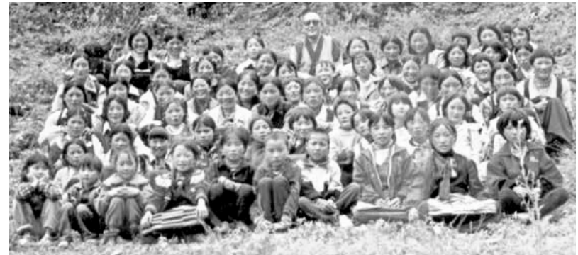
Tenzin Deleg Rinpoche hat sich stets besonders für Kinder eingesetzt

Nun droht auch Lobsang Dhondups langjährigem Weggefährten Tenzin Deleg Rinpoche im Frühjahr 2004 dasselbe Schicksal. Er wird an einem geheimen Ort gefangen gehalten und soll ebenfalls wegen der unbewiesenen Anschuldigung der "Begehen von Sprengstoffdelikten" zu Tode gebracht werden.